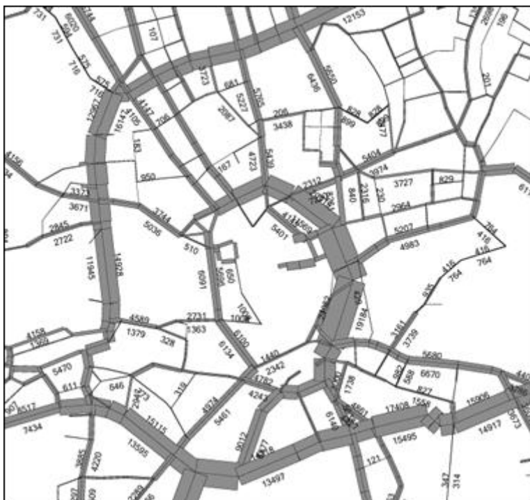
Obrázek 1 Výsledky modelování dopravních objemů v centru Brna.

Multimodální dopravní model města Brna je zpracováván v SW EMME/2 [1, 2] a v současné době dosahuje velikosti 199 centroidů (reprezentujících jednotlivé dopravní zóny nebo vjezdy do modelového území), přibližně 2000 uzlů, 6000 úseků a 120 křižovatek. Model veřejné dopravy zahrnuje všechny linky MHD, příměstské linky IDS JmK, ani úseky železničních tratí ČD do něj implementovány nebyly.