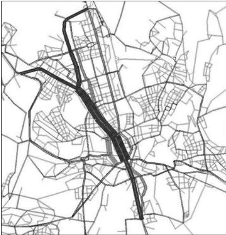
Obrázek 6 Vliv stavby SJTD na změnu přepravních toků ve veřejné dopravě (barvy vyjadřují změnu v dopravních objemech: tmavá - nárůst, světlá - pokles a síla čáry představuje velikost).

(barvy vyjadřují změnu v dopravních objemech: tmavá - nárůst, světlá - pokles a síla čáry představuje velikost).