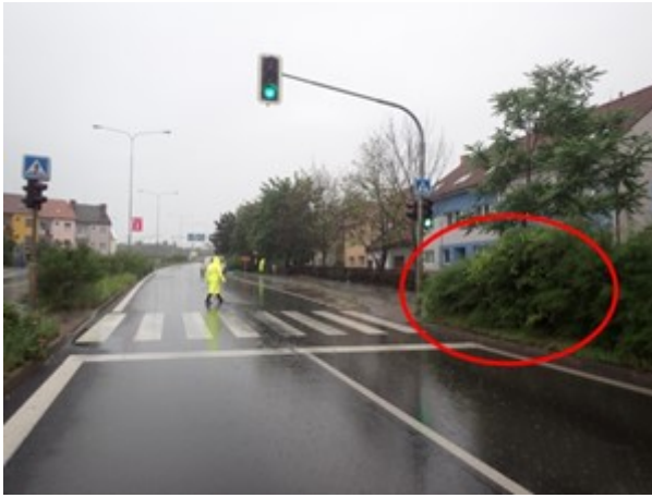
Neudržovaná zeleň v blízkosti přechodu pro chodce

Na Obr. č. 15 je zobrazena možnost spatření chodce řidičem osobního vozidla, které je vzdálené 15 m od přechodu. Kvůli vzrostlé zeleni není možné spatřit chodce dříve. Při rychlosti vozidla 50 km/h a uvažované reakční době 0,8 s je schopen řidič začít brzdit pouze 3 m před přechodem, což znemožňuje včasné zastavení vozidla před přechodem.