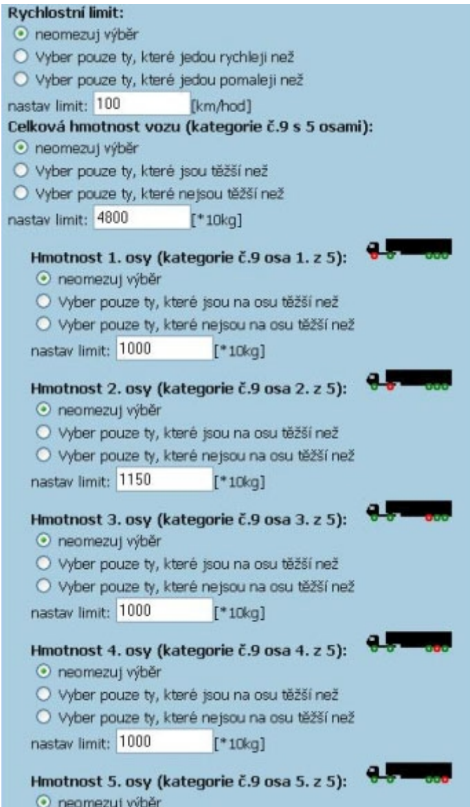
Obr. 3.5.2-2: Výběr a definice parametrů