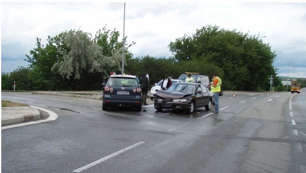
Obr. 2.3 - Nepřehledná křižovatka ulic Ostravská a Holzova v Brně

Příklad špatného dopravního prostoru, který má vliv na vznik nehody, může dokladovat následující snímek. Ukazuje křižovatku v Brně, kde nevhodné dopravní značení mohlo být spolupříčinou vzniku nehody.