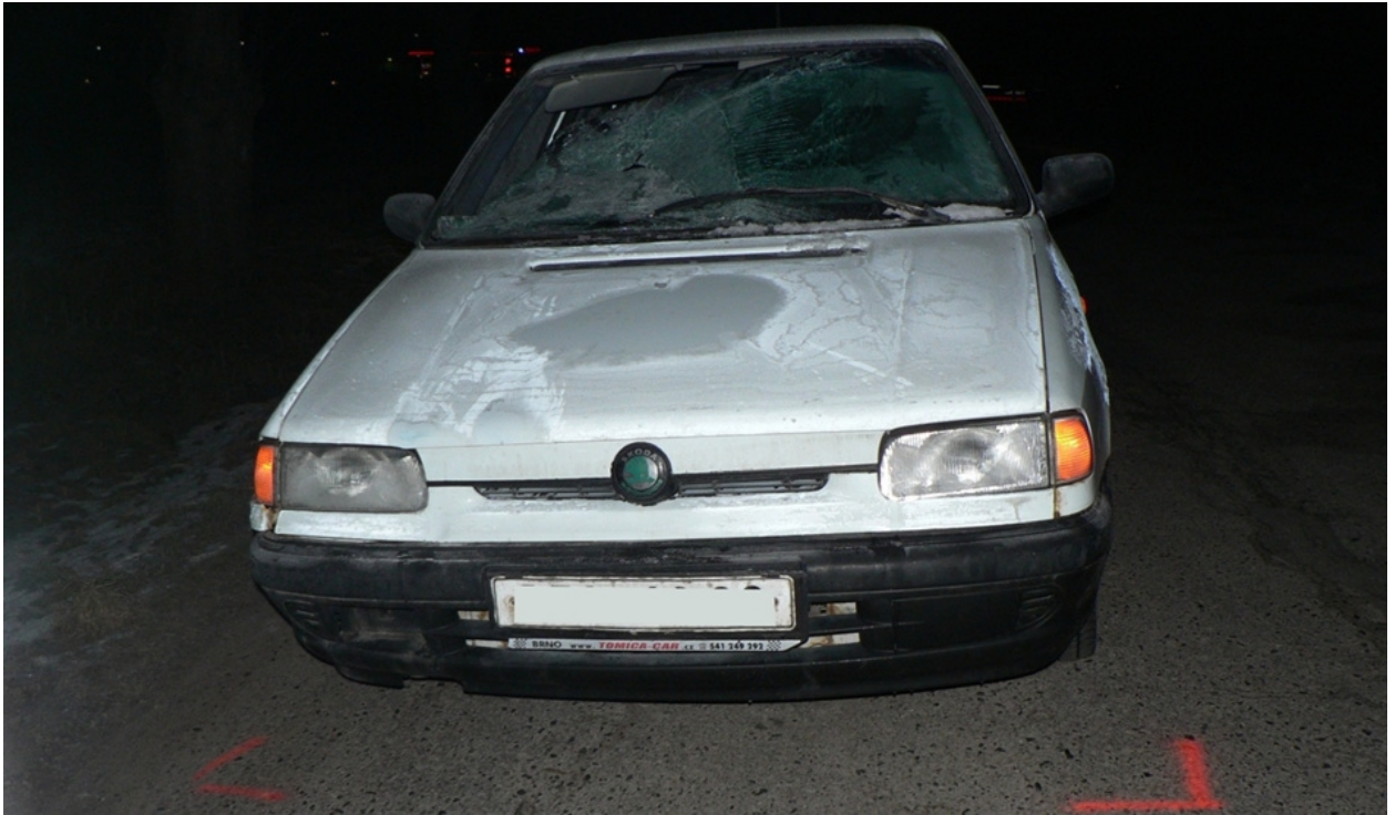
Obr. 2.6 - Zanedbání přípravy vozidla před jízdou (neočištěná námraza na předním skle)