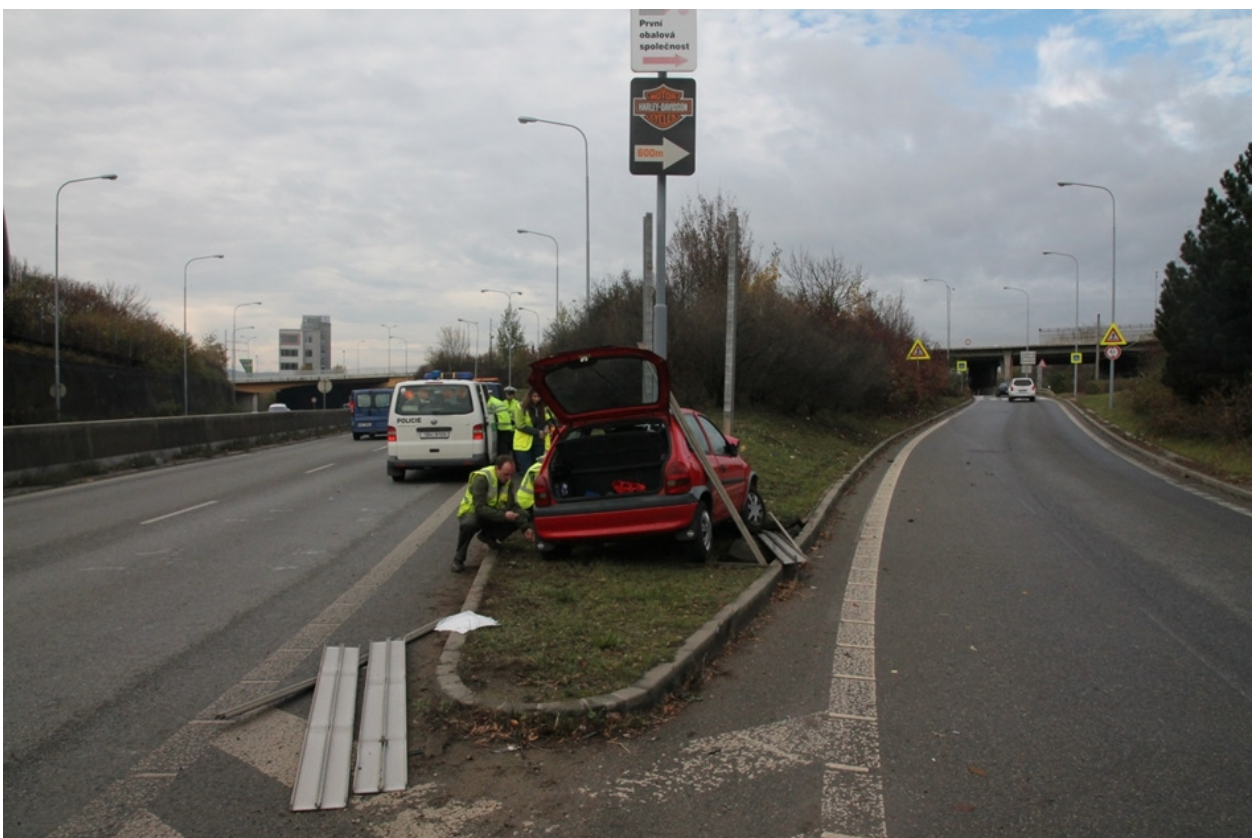
Obr. 2.5 - Pevná překážka provozu na rozštěpu ulic Porgesovy a Křižíkovy v Brně

Příkladem špatného dopravního prostoru, který sice nemá vliv na vznik dopravní nehody, ale výrazně zhoršuje její následky, dokumentuje obrázek křížení (rozštěpu) ulic Porgesovy a Křižíkovy v Brně.