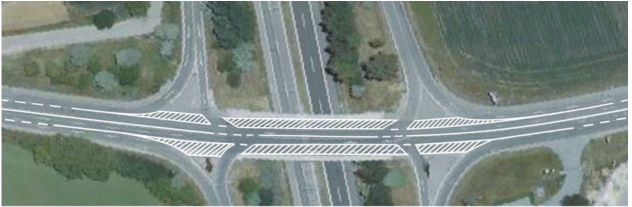
Obr. 2.4 - Návrh možné úpravy křižovatky ulic Ostravská a Holzova v Brně

Příkladem špatného dopravního prostoru, který sice nemá vliv na vznik dopravní nehody, ale výrazně zhoršuje její následky, dokumentuje obrázek křížení (rozštěpu) ulic Porgesovy a Křižíkovy v Brně.