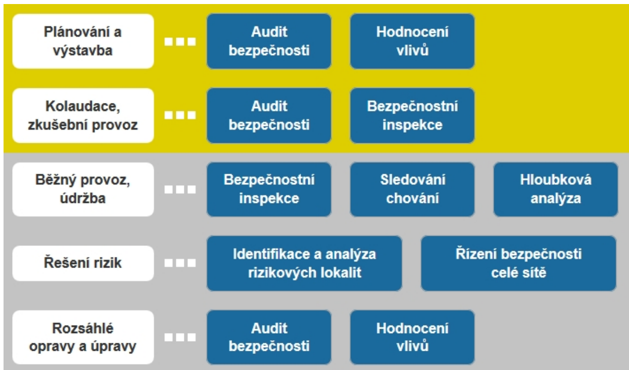
Obr. 2 - Přehled nástrojů pro zvyšování bezpečnosti dle fází životního cyklu pozemních komunikací

Legislativní rámec pro používání některých těchto nástrojů v ČR je dán směrnicí Evropského parlamentu a Rady 2008/96/ES o řízení bezpečnosti silniční infrastruktury ze dne 19. listopadu 2008 a její transpozicí do právního řádu České republiky v roce 2011. Mezi nástroje uvedené v legislativě patří hodnocení dopadů na bezpečnost silničního provozu, audity bezpečnosti, klasifikace vybraných úseků silniční sítě a na to navazujících kontrol na místě, jakož i bezpečnostní inspekce. Směrnice vymezuje pravidla jejich provádění pouze na transevropské silniční síti TEN-T, a to ve všech fázích – projektování, výstavby i provozu. České zákony nijak neomezují a neodebírají státu, krajům a obcím možnost provádět nástroje směrnice také u staveb pozemních komunikací, které jsou v jejich vlastnictví. Vzhledem k tomu, že právě na silnicích nižších kategorií je úroveň bezpečnosti několikanásobně nižší než u silnic v síti TEN-T, je na nich provádění nástrojů žádoucí a Evropskou komisí doporučené. Provádění těchto nástrojů na všech typech komunikací v ČR má podporu také v Národní strategii bezpečnosti silničního provozu 2011 – 2020.