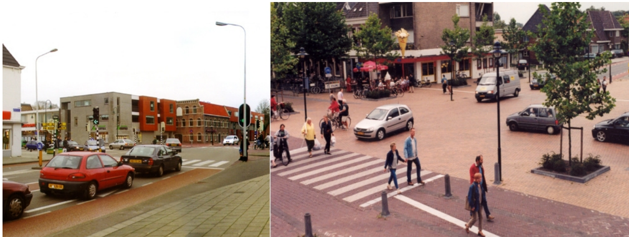
Obr. 7 - Přestavba rušné křižovatky na sdílený prostor - příklad z Nizozemí

CDV se problematikou bezpečnosti zranitelných účastníků provozu, zrovnoprávnění různých druhů dopravy a úprav dopravního prostředí ve městech zabývá intenzivně v podstatě již od svého vzniku v oblastech strategicko-politických (tvorba Národní strategie bezpečnosti a Cyklostrategie), legislativních (příprava technických podmínek jako např. TP 145 - Zásady pro navrhování úprav průtahů silnic obcemi či TP 218 - Navrhování zón 30), osvětových (publikace Moderní úpravy komunikací ve městech a obcích, výzkumných (projekty ROCY, CHODOKO) a konzultačních (zpracování studií zklidnění konkrétních lokalit).