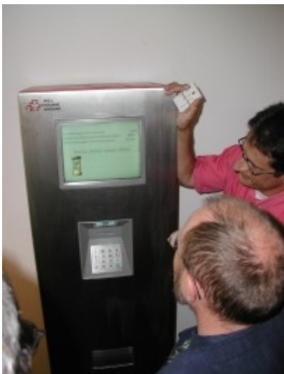
Obr. 5: Terminál systému LSVA

Předpokládá se, že do r. 2006 vzrostou výnosy z vybraných poplatků ze systému LSVA na cca 1,5 mld. CHF. Tento téměř dvojnásobný nárůst bude způsoben navýšením poplatku za použití kilometru silniční sítě a také i tím, že od 1.1.2004 budou moci dopravci po silniční síti jezdit se soupravami o celkové hmotnosti až do 40 tun (dnes je hranicí 34 tun a hranice 40 tun platí pouze v příhraničním pásmu do 10 km). Za zajímavost stojí i fakt, že před zavedením systému LSVA se uvažovalo se zavedením poplatku za použití kilometru silnice, který měl být čtyřnásobkem poplatku dnešního. Provozovatelé systému LSVA předpokládají, že se v systému vyskytuje cca 1% podvodů, přesné číslo však není známo. Podvody jsou zjišťovány především v deklaraci přívěsů – OBU jednotka zaznamenává pouze přítomnost přívěsu, nezjistí jeho váhu.