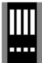
Přejezd pro cyklisty přimknutý k přechodu pro chodce V 8b – platí i pro jezdce na koloběžce

Značka vyznačuje místo určené pro přechod chodců přes pozemní komunikaci.