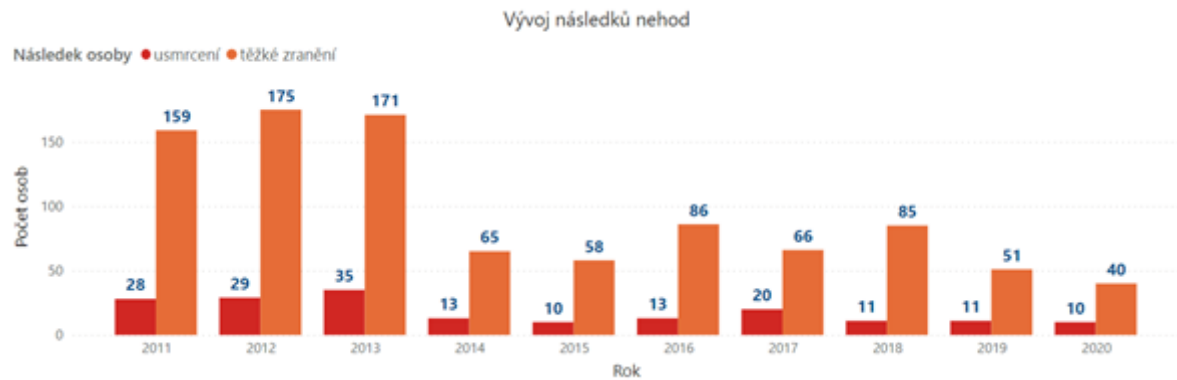
Graf 2 Vývoj závažných následků nehod vzniklých v důsledku vlivu námrazy, sněhu či náledí

Z hlediska regionálního rozložení je možné konstatovat, že k největšímu počtu nejvážnějších nehod v letech 2011-2020 došlo ve Středočeském kraji (193). Nejvíce úmrtí v důsledku nehod vlivem námrazy, sněhu či náledí bylo evidováno v Jihočeském kraji (29).