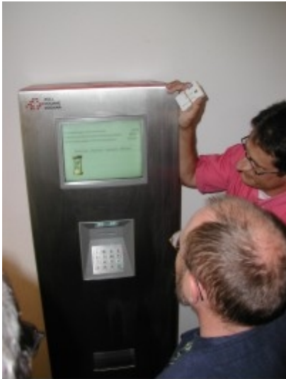
Obr. 5: Terminál systému LSVA

Předpokládá se, že do r. 2006 vzrostou výnosy z vybraných poplatků ze systému LSVA na cca 1,5 mld. CHF. Tento téměř dvojnásobný nárůst bude způsoben navýšením poplatku za použití kilometru silniční sítě a také i tím, že od 1.1.2004 budou moci dopravci po silniční síti jezdit se soupravami o celkové hmotnosti až do 40 tun (dnes je hranicí 34 tun a hranice 40 tun platí pouze v příhraničním pásmu do 10 km). Za zajímavost stojí i fakt, že před zavedením systému LSVA se uvažovalo se zavedením poplatku za použití kilometru silnice, který měl být čtyřnásobkem poplatku dnešního. Provozovatelé systému LSVA předpokládají, že se v systému vyskytuje cca 1% podvodů, přesné číslo však není známo. Podvody jsou zjišťovány především v deklaraci přívěsů – OBU jednotka zaznamenává pouze přítomnost přívěsu, nezjistí jeho váhu.