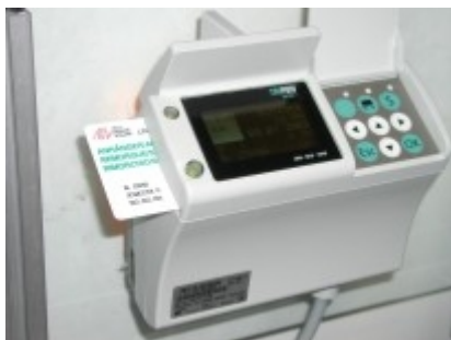
Obr. 1: OBU - palubní jednotka On Board Unit

Výběr poplatků (mýtného) podle výkonu (na základě počtu ujetých km) pro všechny nákladní automobily nad 3,5 tuny určené pro převoz zboží představuje 97% všech výnosů. Další 3% poplatků jsou realizovány formou výběru paušálních poplatků (ročních, denních) za provoz autobusů, přívěsů, apod. Výjimky z placení poplatků platí pro vojenská vozidla, vozidla policie, hasičů a záchranné služby, vozidla s elektrickým pohonem a některé další speciální případy (např. vozidla svážející dřevo).