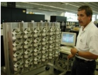
Obr. 6: Testování OBU ve výrobním závodě FELA

Významným prvkem v systému je i ochrana dat. Systém je konstruován tak, aby byla využívána k přenosu pouze ta data, která jsou nezbytná pro stanovení výše poplatku za ujeté kilometry po silnicích. Všechna ostatní data se sbírají pro účely využití ve firmě dopravce a proto tam také zůstávají. GPS data se v současnosti v systému neukládají. OBU jednotky lze už dnes kombinovat s elektronickým tachografem. Využití stávajících zařízení v systému LSVA pro další telematické aplikace se netýká provozovatele systému, tedy ani státu, avšak zařízení, především rozhraní OBU jednotek je připraveno k využití v těchto aplikacích, např. lze připojit vlastní sledovací systémy, apod. Co se týče interoperability systému LSVA se státy EU, systém LSVA bude interoperabilní se systémem zaváděným v Rakousku, o interoperabilitě se systémem zaváděným v SRN se v současnosti intenzívně jedná. V rámci projektu TIS (sdružuje dodavatele EFC systémů ve Španělsku, Francii, Itálii a Řecku) se řeší interoperabilita mezi současně provozovanými EFC systémy v těchto zemích a připravovanými systémy EFC v Evropě vč. provozovaného LSVA s ohledem na platné a nově přijímané normy v rámci CEN TC 278 pro oblast EFC.