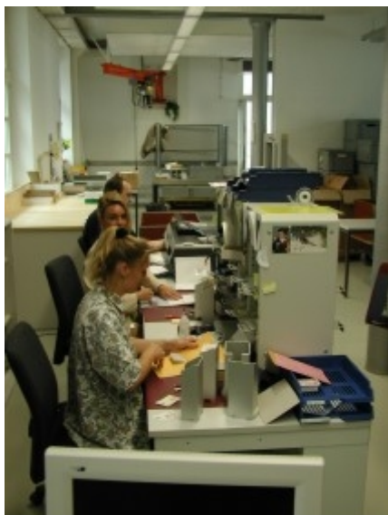
Obr. 2: Zúčtovací pracoviště v Bernu

Denně se výběr poplatků týká cca 52 000 vozidel a 30 000 přívěsů ve vnitrostátní přepravě a cca 21 000 vozidel zahraniční přepravy (cca 50% z těchto vozidel představuje vjezd přes státní hranice a cca 50% výjezd za hranice státu). Jak již bylo shora uvedeno, výběr poplatků za použití švýcarských komunikací podle výkonu se týká všech vozidel s maximální celkovou hmotností nad 3,5 tuny. Protože je výběr prováděn za každý ujetý km v kompletní silniční síti, jedná se o plošný výběr.