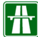
Dálnice IZ 1a