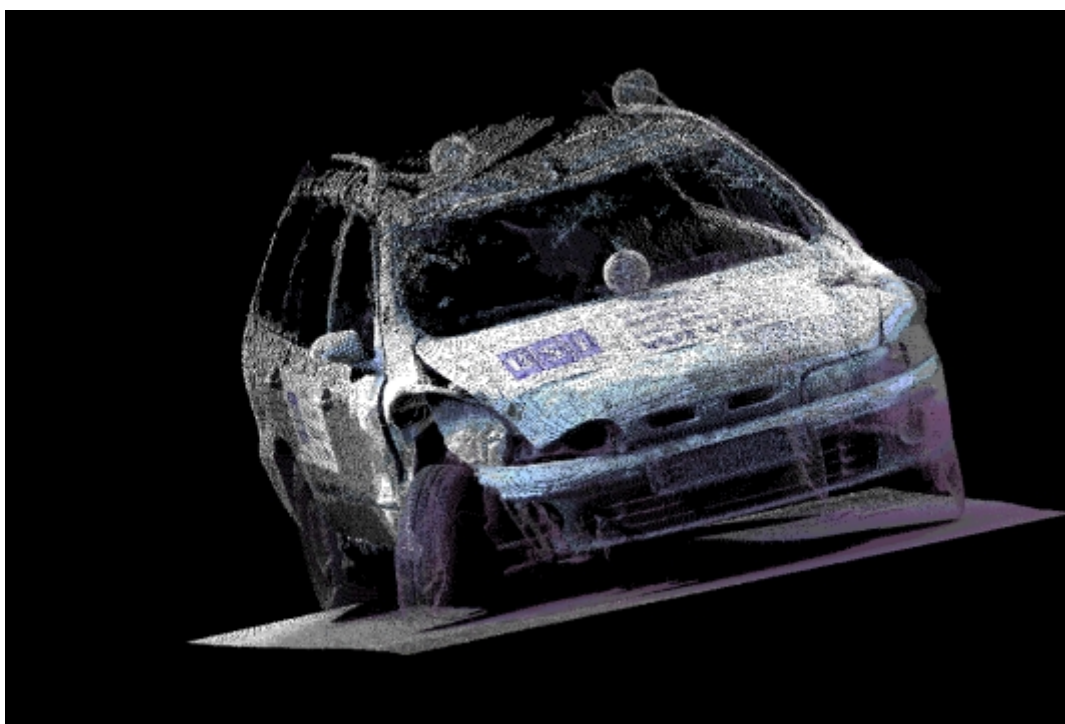
Obr. 3 - Fotografická interpretace 3D modelu havarovaného vozidla