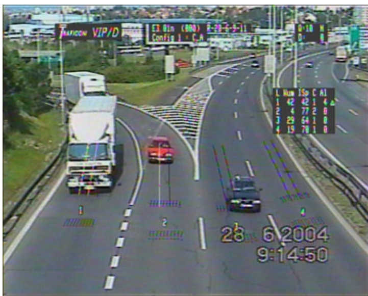
Obr. č. 6b