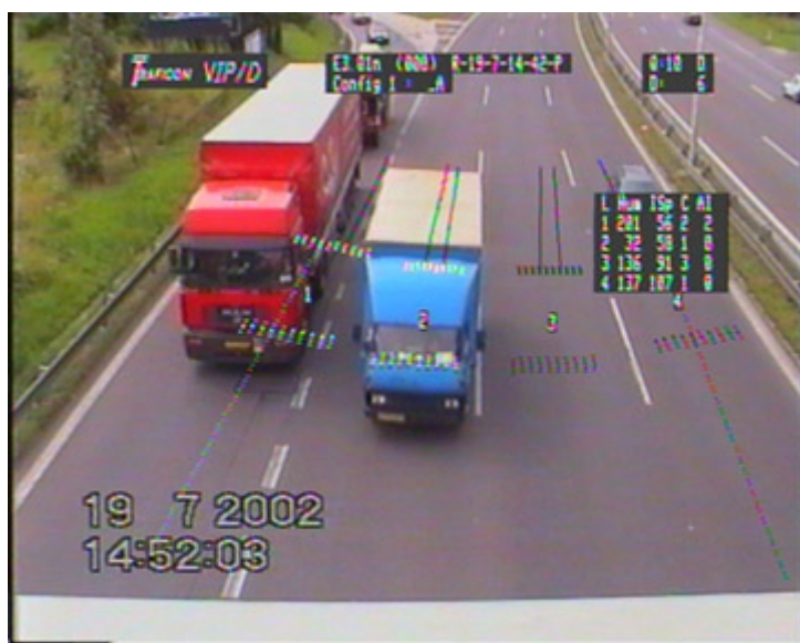
Obr. č. 3