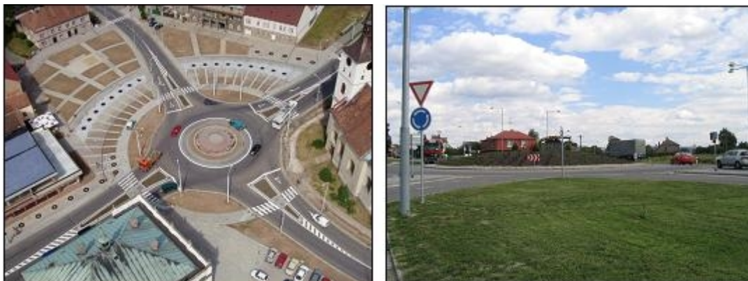
Obrázek 1: Příklady okružních křižovatek ze zkoumaného vzorku. Vlevo - Lázně Bohdaneč; vpravo - Ždírec

Zkoumaný vzorek obsahuje osm původně čtyřramenných průsečných křižovatek, které byly v letech 1998 - 2002 přestavěny na křižovatky okružní. Všechny křižovatky se nacházejí ve městech s počtem obyvatel menším jak 70 000.