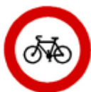
Zákaz vjezdu jízdních kol B 8