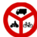
Zákaz vjezdu vyznačených vozidel B 12

Značka zakazuje vjezd cyklistům/jezdcům na koloběžce a jízdu na jízdním kole/koloběžce. Vedení koloběžky je povoleno.