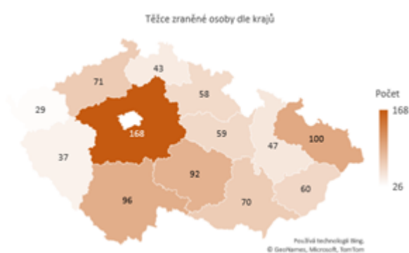
Obrázek 2 Těžce zraněné osoby dle krajů 2011-2020

Dopravní nehody způsobené námrazou, sněhem a náledím mají přirozeně sezónní povahu. K závažným nehodám tak docházelo zejména v prvních třech a posledních dvou měsících jednotlivých let. Závažné následky nehod způsobené tímto vlivem však tvořily malé procento všech závažných následků nehod za těchto 5 měsíců v rámci let 2011-2020. Relativní podíl usmrcených osob při nehodách tohoto typu ke všem usmrceným osobám při dopravních nehodách činil 8,4 %. V případě těžkých zranění se jednalo o 11,8 %.