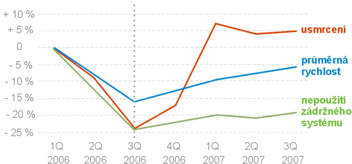
Graf 2 - Vývoj průměrné rychlosti, nepoužívání zádržných systémů a počtu usmrcených při nehodách v období 2006 - 2007

Tečkovaně je v grafu vyznačena novelizace zákona - všechny ukazatele tedy výrazně poklesly, v dalším čtvrtletí však následoval opět nárůst hodnot. Efekt zavedení bodového systému tedy nebyl dlouhodobý.