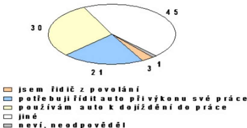
Graf č. 1: Typy řidičů (v %)

Vyškolení tazatelé prováděli sběr dat prostřednictvím dotazníku.