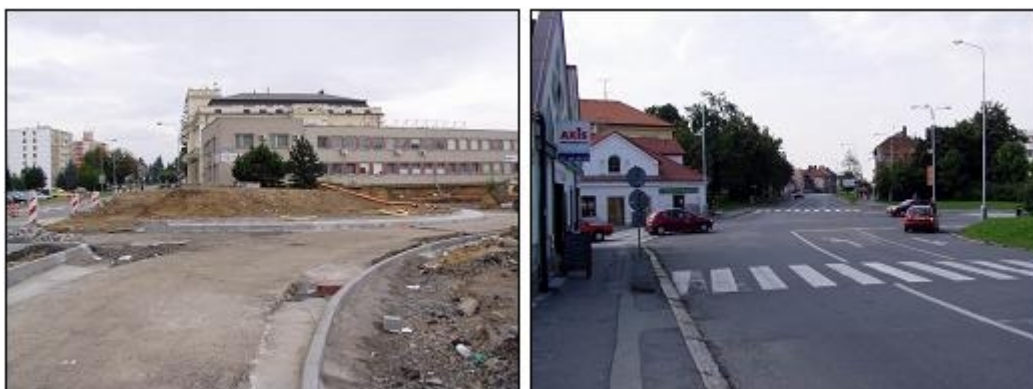
Obr.1 - Vybudovat okružní nebo světelně řízenou křižovatku? Anebo ponechat stávající stav? (Hranice a Čáslav, 2005)

Zdroje určené na financování realizace dopravně bezpečnostních opatření jsou omezené (lépe řečeno jsou velmi malé). Proto je důležité tyto omezené zdroje co nejefektivněji využívat. Tradičními kritérii při rozhodování o realizaci vhodného dopravně-bezpečnostního opatření je jeho legitimita, vhodnost (dopravně inženýrská, občas bohužel i politická) a účinnost. Pro posuzování účinnosti dopravně-bezpečnostních opatření jsou k dispozici vhodné nástroje ( efficiency assessment tools - EATs ), pomocí kterých je možné vybrat mezi možnými opatřeními ty s nejvyšší mírou finanční návratnosti. Mezi nejdůležitější nástroje pro toto vyhodnocování patří analýza efektivity nákladů - CEA ( cost-efficiency analysis ) a analýza nákladů a přínosů - CBA ( cost-benefit analysis ).