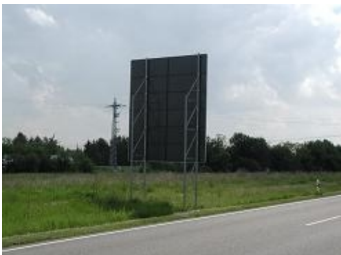
Obr. 6: Příhradové podpěry s možností přejetí (silnice II/416 Pohořelice-Židlochovice)