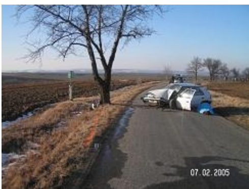
Obr. 7: Tragické následky kolize se stromem (Prostějovsko)