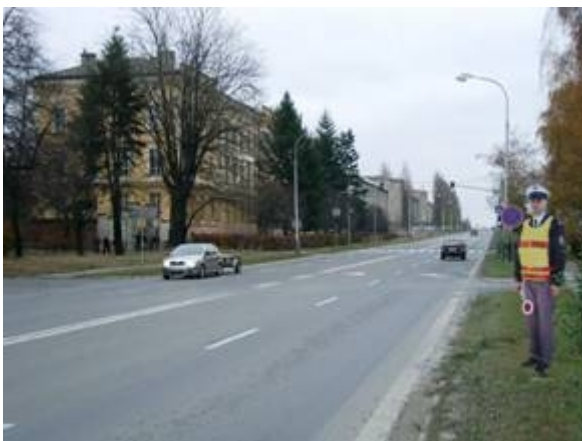
Obr. 4. Poloha lokalit 1 (ulice Hranická) a 2 (ulice Osecká) na silnici I/47

Druhá lokalita (ulice Osecká, obr. 3) se nachází na vjezdu do obce ve směru od Přerova v dlouhém směrovém oblouku. Figurína se nachází cca 20 m před přechodem u budovy ZŠ Osecká, u křižovatky s ulicí Jiráskovou, ve směru do centra. Komunikace je zde dvoupruhová, dělená přerušovanou bílou čarou s podélným parkováním v obou směrech. Chodníky jsou opět odsazené zeleným pásem. Šířkové uspořádání komunikace je méně velkorysé. Překračování nejvyšší povolené rychlosti je ve srovnání s ulicí Hranickou méně časté.