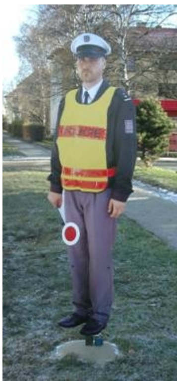
Obr. 1. Použitá figurína policisty

Byly použity plastové figuríny policisty (obr. 1). Vyobrazení je provedeno pouze na čelní straně. Povrch je reflexní a odolný vůči počasí a poničení (sprej, nečistoty). Figuríny nejsou nainstalovány stabilně; podle potřeby jsou vyjímány a znovu nasazovány do zabetonovaného držáku.