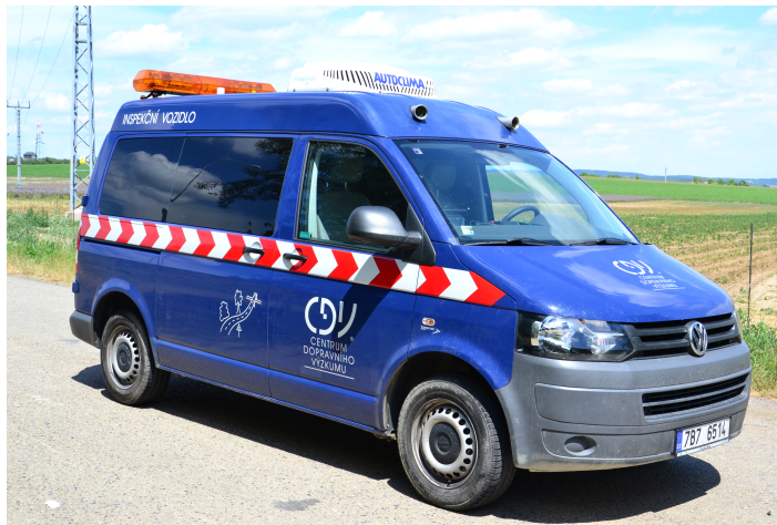
Měřicí vozidlo (inspekční vozidlo)