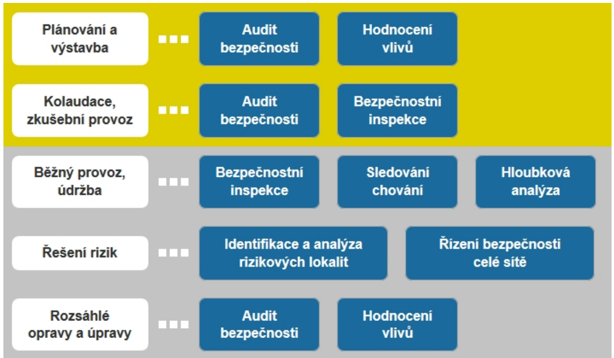
Obr. 2 - Přehled nástrojů pro zvyšování bezpečnosti dle fází životního cyklu pozemních komunikací

Legislativní rámec pro používání některých těchto nástrojů v ČR je dán směrnici Evropského parlamentu a Rady 2008/96/ES o řízení bezpečnosti silniční infrastruktury ze dne 19. listopadu 2008 a její transpozicí do právního řádu České republiky v roce 2011. Mezi nástroje uvedené v legislativě patří hodnocení dopadů na bezpečnost silničního provozu, audity bezpečnosti, klasifikace vybraných úseků silniční sítě a na to navazujících kontrol na místě, jakož i bezpečnostní inspekce. Směrnice vymezuje pravidla jejich provádění pouze na transevropské silniční síti TEN-T, a to ve všech fázích – projektování, výstavby i provozu. České zákony nijak neomezuji a neodebírají státu, krajům a obcím možnost provádět nástroje směrnice také u staveb pozemních komunikací, které jsou v jejich vlastnictví. Vzhledem k tomu, že právě na silnicích nižších kategorií je úroveň bezpečnosti několikánásobně nižší než u silnic v síti TEN-T, je na nich provádění nástrojů žádoucí a Evropskou komisí doporučené. Provádění těchto nástrojů na všech typech komunikací v ČR má podporu také v Národní strategii bezpečnosti silničního provozu 2011 – 2020.