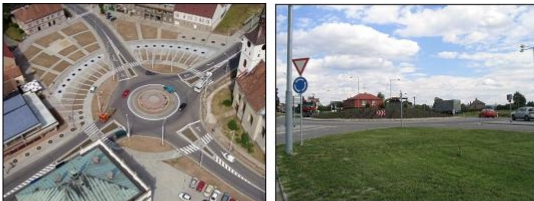
Obrázek 1: Příklady okružních křižovatek ze zkoumaného vzorku. Vlevo - Lázně Bohdaneč; vpravo - Ždírec

Zkoumaný vzorek obsahuje osm původně čtyřramenných průsečných křižovatek, které byly v letech 1998 - 2002 přestavěny na křižovatky okružní. Všechny křižovatky se nacházejí ve městech s počtem obyvatel menším jak 70 000.