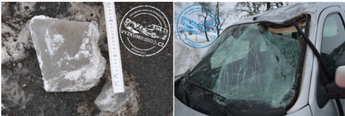
Obrázek 3 Následky dopadu kusu ledu na vozidlo

Ukázku možných následků pádu ledu ze střechy návěsu nákladního vozidla na osobní vozidlo ilustruje příklad dopravní nehody šetřené v rámci Hlubkové analýzy dopravních nehod ( www.vyzkumnehod.cz ). V tomto případě došlo při průjezdu nákladního vozidla Volvo směrovým obloukem k pádu většího kusu ledu na osobní vozidlo jedoucího za nákladním vozidlem. Padající kus ledu dopadl na levý přední roh střechy osobního vozidla, přičemž došlo ke zborcení střechy a proražení čelního skla. Část ledu pronikla do interiéru vozidla, došlo k lehkému zranění řidiče osobního vozidla, zejména v oblasti obličeje.