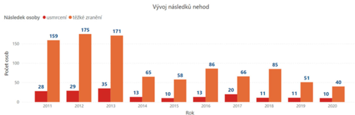
Graf 2 Vývoj závažných následků nehod vzniklých v důsledku vlivu námrazy, sněhu či náledí

Z hlediska regionálního rozložení je možné konstatovat, že k největšímu počtu nejzávažnějších nehod v letech 2011-2020 došlo ve Středočeském kraji (193). Nejvíce úmrtí v důsledku nehod vlivem námrazy, sněhu či náledí bylo evidováno v Jihočeském kraji (29).