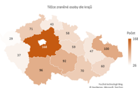
Obrázek 2 Těžce zraněné osoby dle krajů

Dopravní nehody způsobené námrazou, sněhem a náledím mají přirozeně sezónní povahu. K závažným nehodám tak docházelo zejména v prvních třech a posledních dvou měsících jednotlivých let. Závažné následky nehod způsobené tímto vlivem však tvořily malé procento všech závažných následků nehod za těchto 5 měsíců v rámci let 2011-2020. Relativní podíl usmrcených osob při nehodách tohoto typu ke všem usmrceným osobám při dopravních nehodách činil 8,4 %. V případě těžkých zranění se jednalo o 11,8 %.