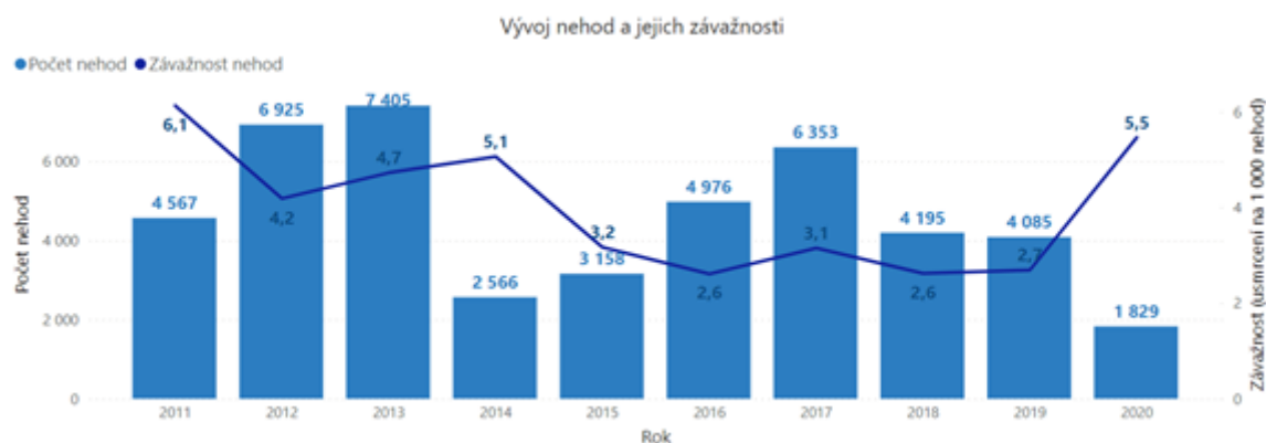
Graf 1 Vývoj dopravních nehod a jejich závažnosti vzniklých v důsledku vlivu námrazy, sněhu či náledí

„V roce 2020 bylo v důsledku vlivu námrazy, sněhu a náledí evidováno 1829 dopravních nehod. Při nich zemřelo 10 lidí a dalších 40 bylo těžce zraněno, lehce bylo zraněno 619 osob. Počet těchto dopravních nehod byl v roce 2020 nejnižší za 10 let. Opět ale musíme připomenout, že uplynulý rok byl ovlivněn omezeními v dopravě souvisejícími s epidemií COVID-19,“ řekl vedoucí oddělení BESIP Ministerstva dopravy Tomáš Neřold. Oproti předchozímu roku bylo usmrceno o 1 osobu méně, o 11 klesl také počet těžce zraněných. V důsledku většího poklesu počtu dopravních nehod způsobených námrazou, sněhem či náledím než poklesu počtu usmrcených došlo k více než 100% nárůstu závažnosti nehod. Závažnost nehod je definována jako počet usmrcených osob na 1000 nehod. V roce 2020 dosáhla hodnoty 5,5.