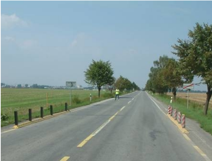
Obrázek 2: Pohled na vjezd od Prostějova s realizovaným opatřením (8/2005)

Definitivním řešením bylo následné vybudování fyzického vjezdového ostrůvku (podzim 2005). Ostrůvek byl proveden podle TP 145 v oboustranné verzi. Oboustranně vychýlený ostrůvek spolehlivě zabraňuje přenosu vysokých rychlostí z extravilánu do intravilánu. Ostrůvek zvyšuje bezpečnost provozu i tím, že znemožňuje nebezpečné předjíždění a homogenizuje pohyb dopravního proudu.