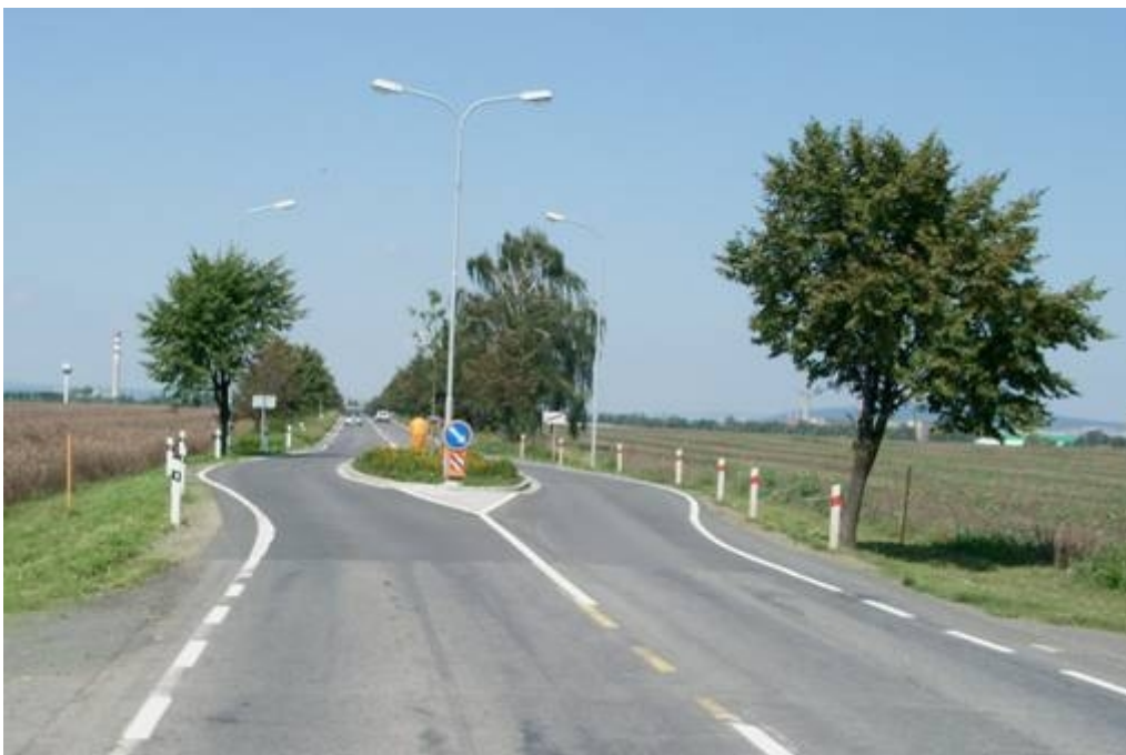
Obrázek 3: Definitivní řešení vjezdovým ostrůvkem (8/2006)

Definitivním řešením bylo následné vybudování fyzického vjezdového ostrůvku (podzim 2005). Ostrůvek byl proveden podle TP 145 v oboustranné verzi. Oboustranně vychýlený ostrůvek spolehlivě zabraňuje přenosu vysokých rychlostí z extravilánu do intravilánu. Ostrůvek zvyšuje bezpečnost provozu i tím, že znemožňuje nebezpečné předjíždění a homogenizuje pohyb dopravního proudu.