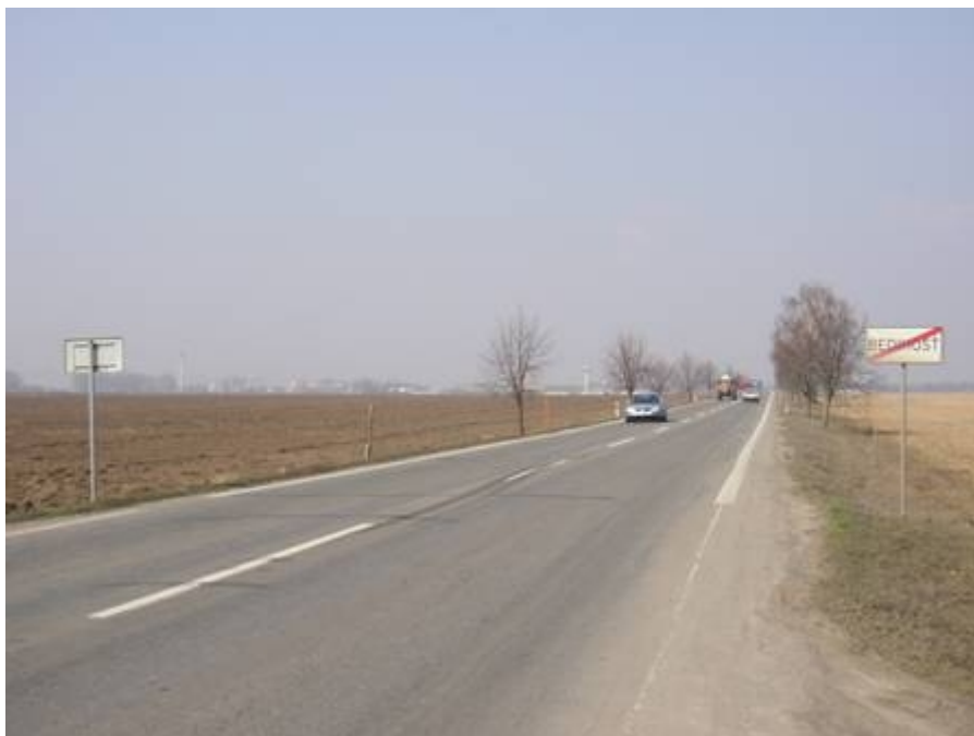
Obrázek 1: Vjezd do Bedihošti od Prostějova – místo současného vjezdového ostrůvku (3/2003)

Obec Bedihošť leží na silnici II/367 mezi Prostějovem a Kojetínem. Komunikace dále navazuje na silnici I/47 na Kroměříž a Hulín. Obec Bedihošť je vzdálena cca 4 km od Prostějova. Sledovaný úsek Prostějov – Bedihošť je proveden v kategorii S9,5/90, směrové uspořádání je přímé.