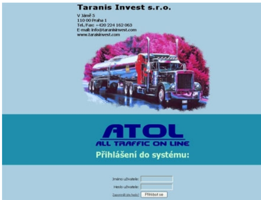
Obr. 3.2-1: Přihlášení do systému

V případě, že uživatel zapomněl své heslo, bude mu heslo zasláno e-mailem na nastavenou adresu po stisknutí odkazu Zapomněli jste heslo?.