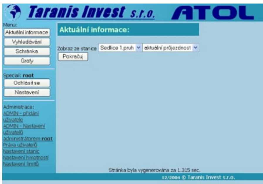
Obr. 3.4-1: Aktuální informace