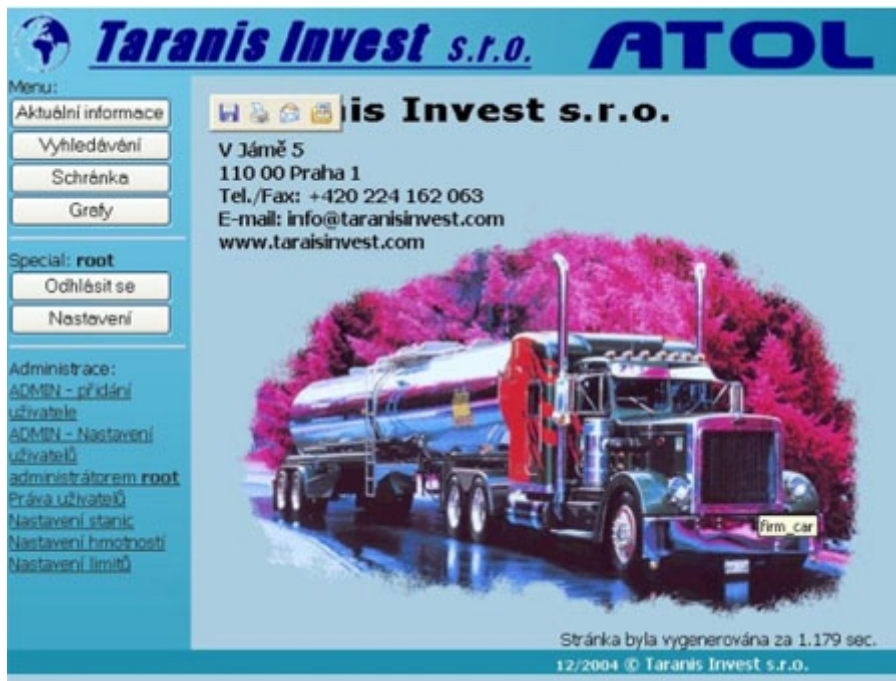
Obr. 3.3-1: Základní okno aplikace

Obrázek 3.3-1 znázorňuje základní okno aplikace. Zde je možný přístup k jednotlivým funkcím a modulům ATOLu. Základní menu se skládá z následujících položek: