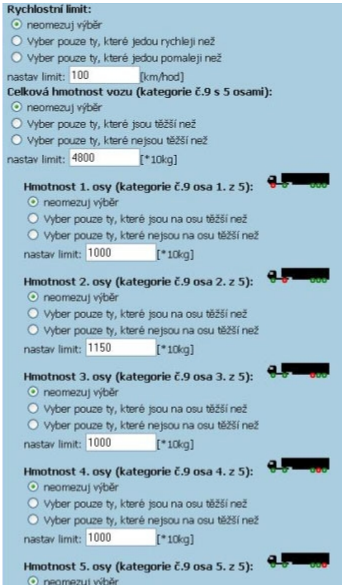
Obr. 3.5.2-2: Výběr a definice parametrů