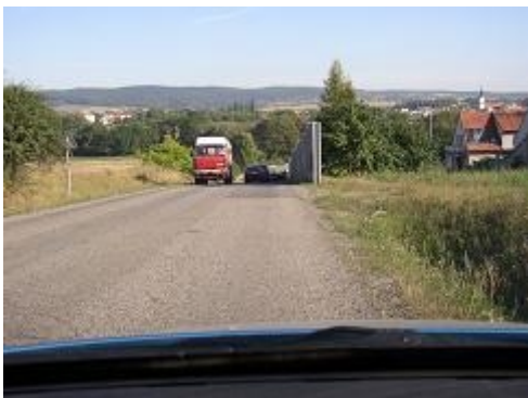
Obr. 8: Nebezpečný okraj protihlukové zdi (přivaděč dálnice D 1, Rousínov)