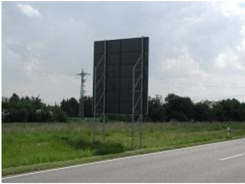
Obr. 6: Příhradové podpěry s možností přejetí (silnice II/416 Pohořelice-Židlochovice)