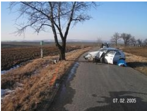
Obr. 7: Tragické následky kolize se stromem (Prostějovsko)