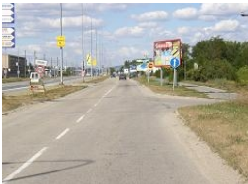
Obr. 3: Zanikající značka „STOP“ mezi reklamami (stará I/52 Brno-Pohořelice)