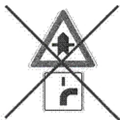
Obr. 17: Psychologicky velmi nebezpečná kombinace dopravních značek