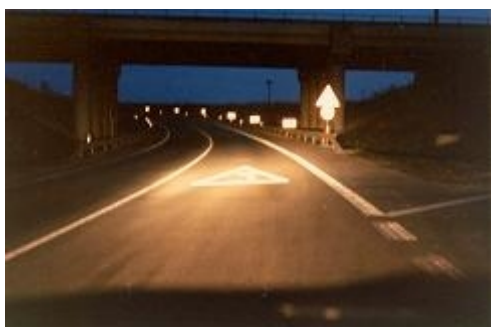
Obr. 2: Dřívě nehodová zatáčka na okraji Písku (noc)