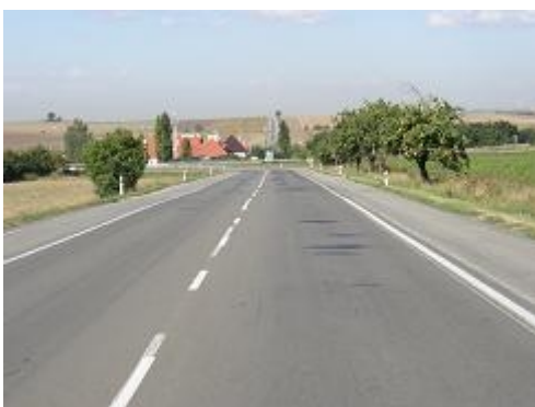
Obr. 10: Nedostatečně označená nebezpečná zatáčka (II/430 Vyškov-Brno)