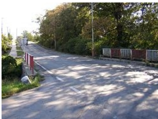
Obr. 18: Nákladní automobil zakrytý značkou (II/430, Rousínov)