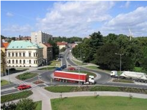
Obr. 23: Styková křižovatka nahrazená okružní (I/37, Chrudim)