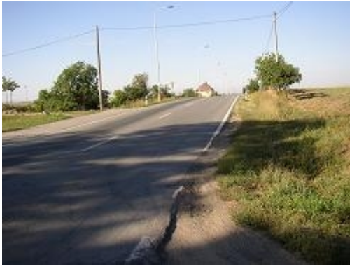
Obr. 19: Nedostatečný dohled na hlavní silnici (II/430, Rousínov)