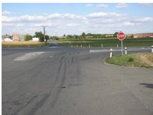
Obr. 14: Psychologická přednost, rozlehlé plochy (křižovatka na I/52 u Pohořelic)