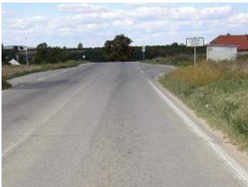
Obr. 9: Ztracená trasa - výškový zlom (stará I/52 Brno-Pohořelice)