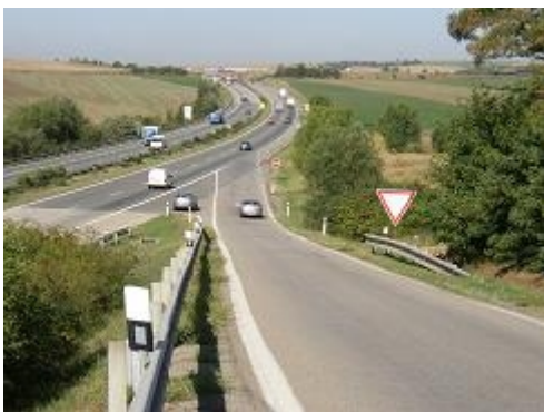
Obr. 11: Chybějící připojovací pruh (D 1, Rohlenka)