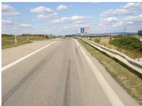
Obr. 13: Psychologická přednost, liniové prvky (připojení dálnice D 2, Brno-Chrlice)