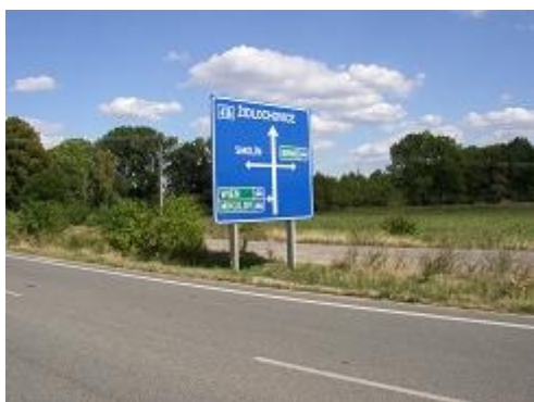
Obr. 5: Agresivní podpěrné konstrukce profilu I (SRN)