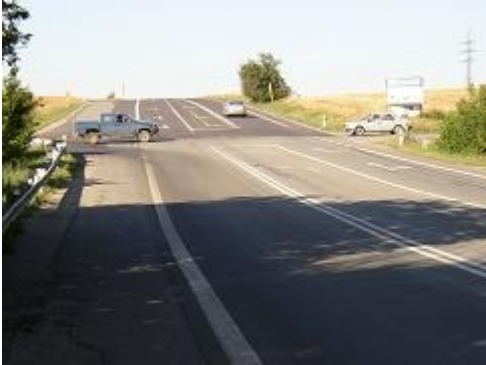
Obr. 22: Rozlehlá a nebezpečná kolizní plocha (II/430, Vyškov-Brno)