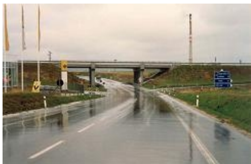
Obr. 1: Dřívě nehodová zatáčka na okraji Písku (den)

Principem bezpečného utváření komunikací je snaha vyvarovat se faktorů, které usnadňují vznik nehod, resp. faktorů, které by zhoršovaly jejich následky. Důležitou součástí problematiky bezpečného utváření pozemních komunikací je též systematické hledání a odstraňování tzv. nehodových lokalit , neboli míst častých dopravních nehod. Jde o efektivní záležitost, neboť více než třetina dopravních nehod se koncentruje na pouhých 3 % délky komunikační sítě. Podstata existence nehodových lokalit většinou spočívá právě na přítomnosti nějaké okolnosti na pozemní komunikaci, která vznik nehod usnadňuje. Tuto okolnost je nutno zjistit pomocí rozboru nehodovosti a odstranit. Zkušenosti ukazují, že zmírnění nehodovosti je často možné i velmi jednoduchými a finančně nenáročnými, leč promyšlenými opatřeními. Obrázky 1 a 2 ukazují příklad zatáčky s původně extrémně vysokou nehodovostí, kde se situace podstatně zlepšila upozorněním na zatáčku (pro řidiče neočekávanou) a zvýrazněním jejího průběhu (je prudší, než na první pohled vypadá).