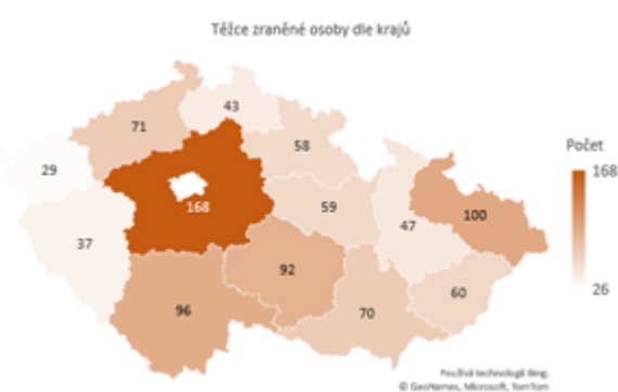
Obrázek 2 Těžce zraněné osoby dle krajů

Dopravní nehody způsobené námrazou, sněhem a náledím mají přirozeně sezónní povahu. K závažným nehodám tak docházelo zejména v prvních třech a posledních dvou měsících jednotlivých let. Závažné následky nehod způsobené tímto vlivem však tvořily malé procento všech závažných následků nehod za těchto 5 měsíců v rámci let 2011-2020. Relativní podíl usmrcených osob při nehodách tohoto typu ke všem usmrceným osobám při dopravních nehodách činil 8,4 %. V případě těžkých zranění se jednalo o 11,8 %.