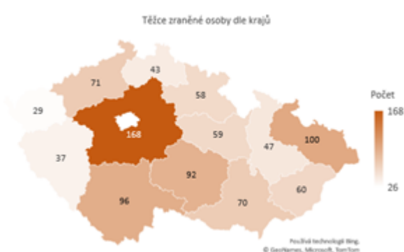
Obrázek 2 Těžce zraněné osoby dle krajů

Dopravní nehody způsobené námrazou, sněhem a náledím mají přirozeně sezónní povahu. K závažným nehodám tak docházelo zejména v prvních třech a posledních dvou měsících jednotlivých let. Závažné následky nehod způsobené tímto vlivem však tvořily malé procento všech závažných následků nehod za těchto 5 měsíců v rámci let 2011-2020. Relativní podíl usmrcených osob při nehodách tohoto typu ke všem usmrceným osobám při dopravních nehodách činil 8,4 %. V případě těžkých zranění se jednalo o 11,8 %.