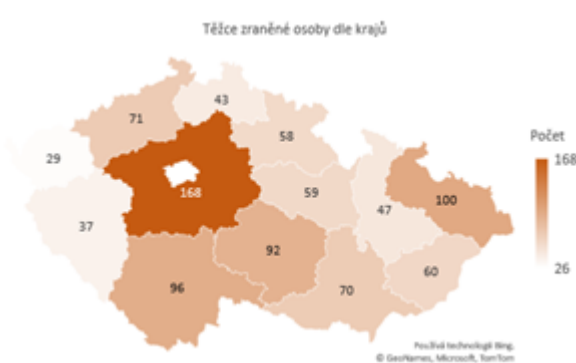
Obrázek 2 Těžce zraněné osoby dle krajů

Dopravní nehody způsobené námrazou, sněhem a náledím mají přirozeně sezónní povahu. K závažným nehodám tak docházelo zejména v prvních třech a posledních dvou měsících jednotlivých let. Závažné následky nehod způsobené tímto vlivem však tvořily malé procento všech závažných následků nehod za těchto 5 měsíců v rámci let 2011-2020. Relativní podíl usmrcených osob při nehodách tohoto typu ke všem usmrceným osobám při dopravních nehodách činil 8,4 %. V případě těžkých zranění se jednalo o 11,8 %.