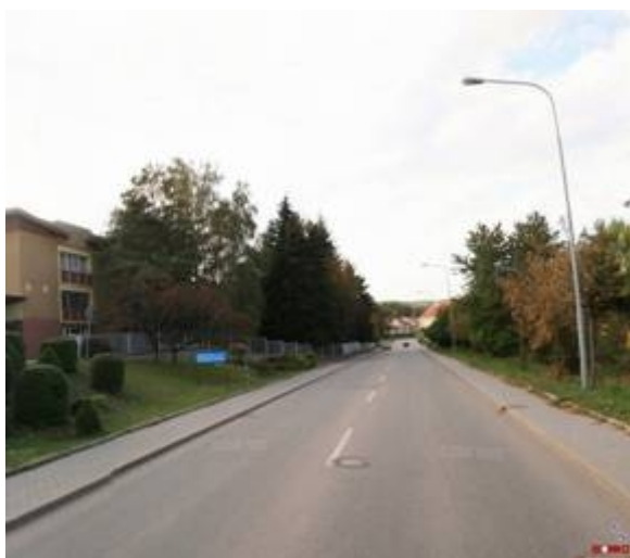
Obrázek 3 - současný stav

Víceúčelový pruh je tedy motivován snahou odsunout automobily dále od pravého okraje vozovky a lépe využívat jinak málo pojížděný střed vozovky tak, aby pro cyklisty zůstávalo vpravo volné místo pro jízdu ( viz obrázky 3 a 4 ).