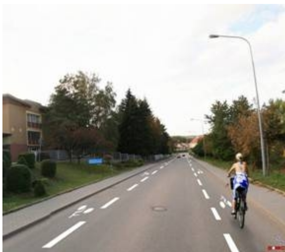
Obrázek 4 - animace řešení (ADOS, s r.o.)

Řešení se též s velkou výhodou uplatní např. před světelně řízenými křižovatkami, kde je tak cyklistovi zaručena možnost objet frontu čekajících vozidel a přijet až k SSZ (jde o vynikající formu preference cyklistů, viz obrázky 5 a 6).