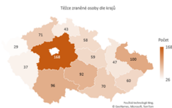
Obrázek 2 Těžce zraněné osoby dle krajů

Dopravní nehody způsobené námrazou, sněhem a náledím mají přirozeně sezónní povahu. K závažným nehodám tak docházelo zejména v prvních třech a posledních dvou měsících jednotlivých let. Závažné následky nehod způsobené tímto vlivem však tvořily malé procento všech závažných následků nehod za těchto 5 měsíců v rámci let 2011-2020. Relativní podíl usmrcených osob při nehodách tohoto typu ke všem usmrceným osobám při dopravních nehodách činil 8,4 %. V případě těžkých zranění se jednalo o 11,8 %.