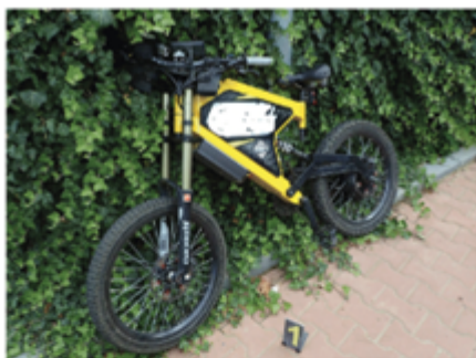
Nezákonný výkon a rychlost (střetová rychlost 15 km/h) cyklista neměl přilbu, těžké zranění