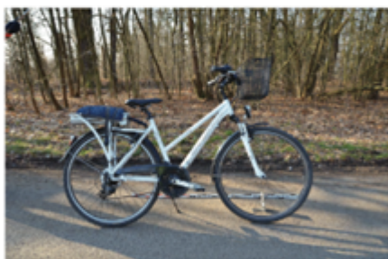
Cyklista nedostal přednost v jízdě (střetová rychlost 15 km/h) cyklista neměl přilbu, lehké zranění