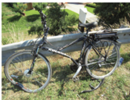
Vjetí do protisměru (střetová rychlost 30 km/h) cyklista měl přilbu, lehké zranění