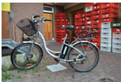
Nedání přednosti v jízdě (střetová rychlost 15 km/h) cyklista neměl přilbu, lehké zranění