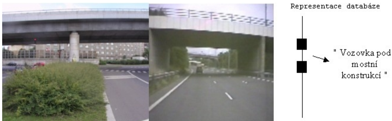
Obr. 3: Reálná situace případu Vozovka pod silniční konstrukcí, Praha 9

Reálný příklad mostní konstrukce je znázorněn na obrázku 3.