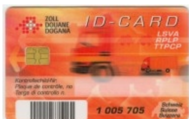
Obr. 3: Čipová ID karta

Všechna tuzemská nákladní vozidla s hmotností nad 3,5 tuny musí být povinně vybavena OBU jednotkou, existuje asi jen 500 výjimek. Zahraniční vozidla mohou být vybavena OBU jednotkou, ale nemusí, pak provádí platbu za ujeté km hotově pomocí terminálů. V současnosti je u zahraničních vozidel nainstalováno pouze cca 2 000 ks OBU jednotek (především se jedná o vozidla z příhraniční oblasti). OBU jednotky jsou distribuovány dopravcům zdarma, uživatel platí jejich instalaci do vozidla. Cena instalace OBU se pohybuje v rozmezí 250,- až 300,- CHF.