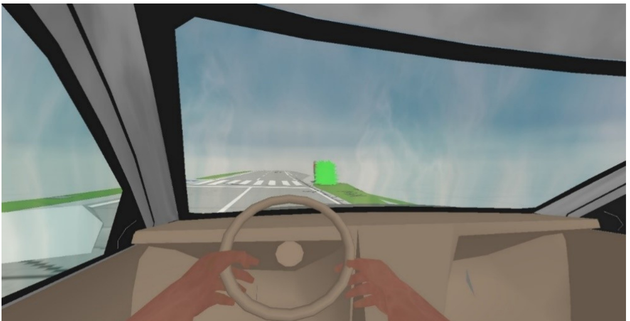
Omezení výhledu řidiče osobního vozidla na chodce v případě zeleň u přechodu pro chodce

Na Obr. č. 15 je zobrazena možnost spatření chodce řidičem osobního vozidla, které je vzdálené 15 m od přechodu. Kvůli vzrostlé zeleň není možné spatřit chodce dříve. Při rychlosti vozidla 50 km/h a uvažované reakční době 0,8 s je schopen řidič začít brzdit pouhé 3 m před přechodem, což znemožňuje včasné zastavení vozidla před přechodem.