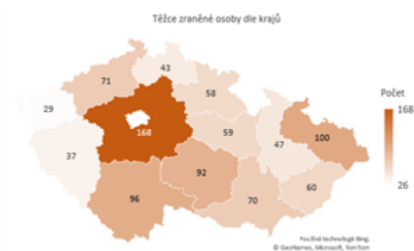
Obrázek 2 Těžce zraněné osoby dle krajů

Dopravní nehody způsobené námrazou, sněhem a náledím mají přirozeně sezónní povahu. K závažným nehodám tak docházelo zejména v prvních třech a posledních dvou měsících jednotlivých let. Závažné následky nehod způsobené tímto vlivem však tvořily malé procento všech závažných následků nehod za těchto 5 měsíců v rámci let 2011-2020. Relativní podíl usmrcených osob při nehodách tohoto typu ke všem usmrceným osobám při dopravních nehodách činil 8,4 %. V případě těžkých zranění se jednalo o 11,8 %.