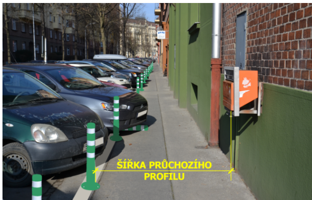
Obrázek 08. Flexibilní regulační sloupek - zelený

Na obr. 08 je provedena grafická simulace osazení zelených flexibilních sloupků jako podpora zachování šířky průchozího prostoru chodníku v obci. Právě v těchto situacích spočívá hlavní ohnisko využití flexi sloupků. Sloupek vozidlo nepoškodí, ale klade dostatečný odpor, aby si řidič uvědomil, že najíždí do jemu zakázaného prostoru. Realizace balisety v tomto místě je sice možná, ale její profil by zbytečně zabíral cenné centimetry přidruženého prostoru komunikace v obci. Na obr. 09 je znázorněno vhodné použití balisety jako podpory vodorovného dopravního značení na silnici I. třídy mimo obec. Zelený sloupek s bílými odrazovými plochami vymezuje prostor určený pro dopravní stín.