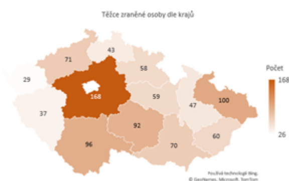
Obrázek 2 Těžce zraněné osoby dle krajů

Dopravní nehody způsobené námrazou, sněhem a náledím mají přirozeně sezónní povahu. K závažným nehodám tak docházelo zejména v prvních třech a posledních dvou měsících jednotlivých let. Závažné následky nehod způsobené tímto vlivem však tvořily malé procento všech závažných následků nehod za těchto 5 měsíců v rámci let 2011-2020. Relativní podíl usmrcených osob při nehodách tohoto typu ke všem usmrceným osobám při dopravních nehodách činil 8,4 %. V případě těžkých zranění se jednalo o 11,8 %.