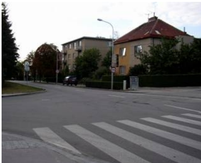
Obr. 2. Pohled na zařízení

Jedná se o zařízení pro provozní informace I1 umístěné na fluorescenčním podkladu a doplněné o symbol zákazové dopravní značky č. B20a „Nejvyšší dovolená rychlost 30 km/h“. Ve štítu zařízení je umístěn radar pro měření vybavený displejem pro zobrazení okamžité rychlosti projíždějícího vozidla a záznamovým zařízením. Zobrazovací elementy displeje tvoří fluorescenční retroreflexní sklopné segmenty a LED diody. Celá konstrukce zajišťuje dokonalou viditelnost za jakýchkoliv světelných podmínek. Zařízení je instalováno na sloupu veřejného osvětlení na začátku úseku s nejvyšší dovolenou rychlostí 30 km/h spolu se zákazovou dopravní značkou č. B21a „Zákaz předjíždění“ (viz obr. 2).