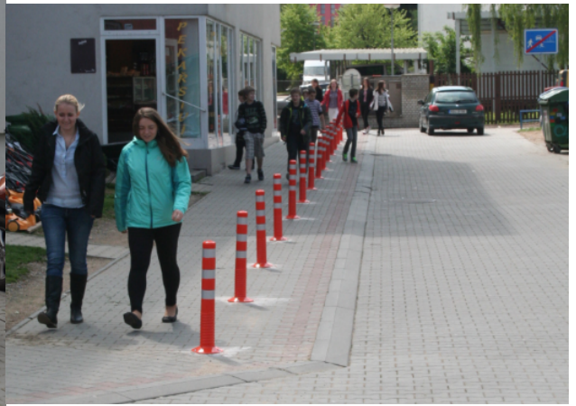
Obrázek 07. Benešov - krátce po osazení

Pohyb chodců se ihned po osazení sloupků usměrnil do vymezeného prostoru. Po osazení sloupků došlo k zamezení odstavování vozidel v tomto prostoru (viz Obrázek 07). Reakce rezidentů byly však různé. Učitelky z blízké školy téměř s nadšením kvitovaly nové opatření s tím, že něco takového bylo dlouho potřeba. Naopak místní obchodníci s nastalou situací vyjádřili poměrně hlasitý nesouhlas. A tak vozidla pro zásobování byla stále odstavována v blízkosti obchodů, ale nyní už za sloupky. Bohužel v krátkém časovém období (cca dva měsíce) byly některé sloupky zničeny neznámým vandalem. Situaci řešila Policie ČR jako přečin Poškození cizí věci. Nutno přiznat, že kotvení sloupků v zámkové dlažbě v této lokalitě nebylo příliš efektivní. Dlažba byla pro povrchové kotvení pomocí hmoždinek a krátkých šroubů příliš nekompaktní. Městu byla nabídnuta okamžitá výměna sloupků s tím, že by všechny sloupky byly zakotveny do nové betonové patky. Zástupci města chtěli situaci řešit komplexně a rozhodli se vybudovat odstavná stání pro zásobování a teprve poté sloupky znovu osadit.