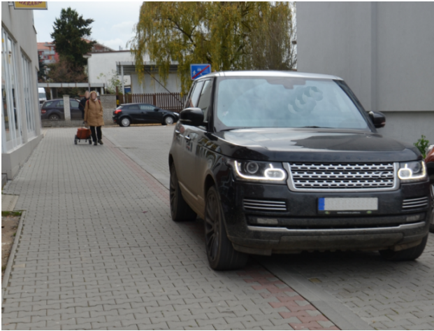
Obrázek 06. Benešov - před osazením