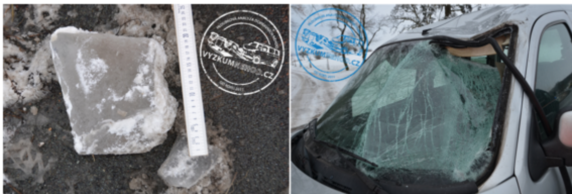
Obrázek 3 Následky dopadu kusu ledu na vozidlo

Ukázku možných následků pádu ledu ze střechy návěsu nákladního vozidla na osobní vozidlo ilustruje příklad dopravní nehody šetřené v rámci Hlubkové analýzy dopravních nehod ( www.vyzkumnehod.cz ). V tomto případě došlo při průjezdu nákladního vozidla Volvo směrovým obloukem k pádu většího kusu ledu na osobní vozidlo jedoucího za nákladním vozidlem. Padající kus ledu dopadl na levý přední roh střechy osobního vozidla, přičemž došlo ke zborcení střechy a proražení čelního skla. Část ledu pronikla do interiéru vozidla, došlo k lehkému zranění řidiče osobního vozidla, zejména v oblasti obličeje.