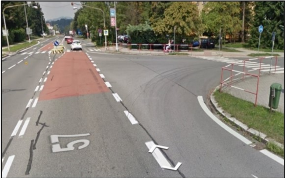
Obr. 3 Nehodová lokalita na silnici I/53, ulice Vsetínská, zdroj: https://nehody.cdv.cz/statistics.php