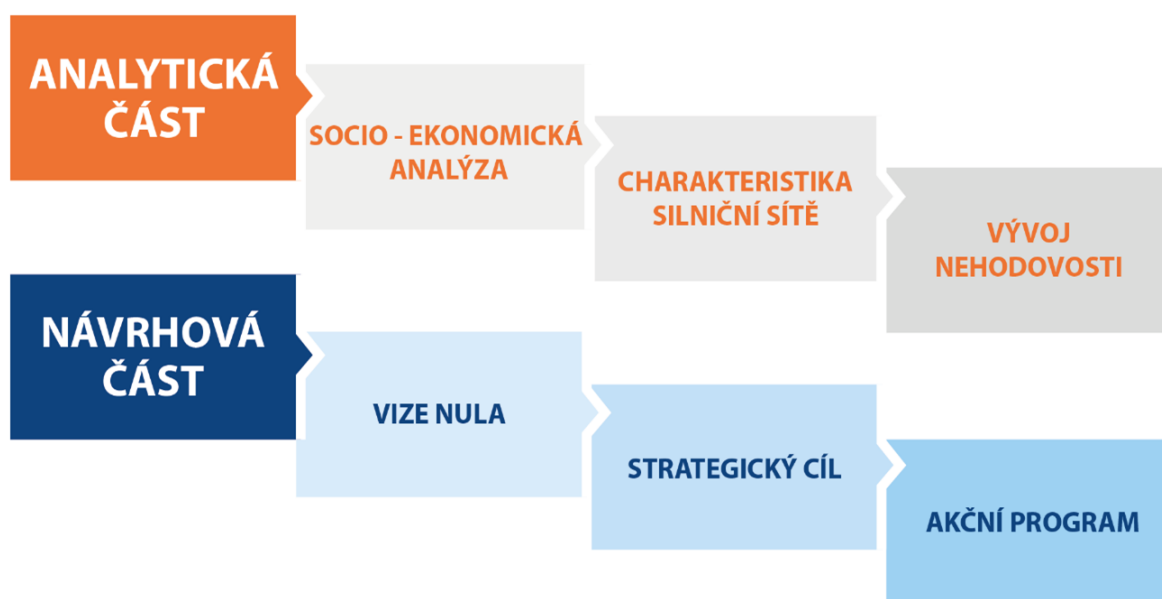
Obr. 1: Fáze zpracování strategie BESIP města (obce)

Jednotlivé fáze zpracování Strategie BESIP města (obce) jsou znázorněny na následujícím Obr. 1. Na analytickou část, která je tvořena socioekonomickou analýzou, charakteristikou sítě pozemních komunikací a vývojem nehodovosti, navazuje část strategická a realizační s konkrétními opatřeními navrženými akčním plánem.