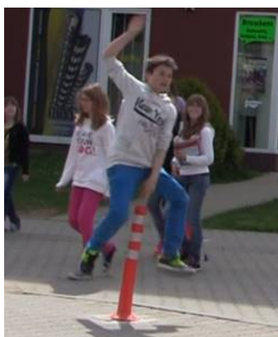
Obrázek 20. Benešov - 12 měsíc

Dalšími výhodami sloupků je jejich snadná/rychlá montáž a výměna, variabilita provedení (design), nízká cena v porovnání se stavebními úpravami.