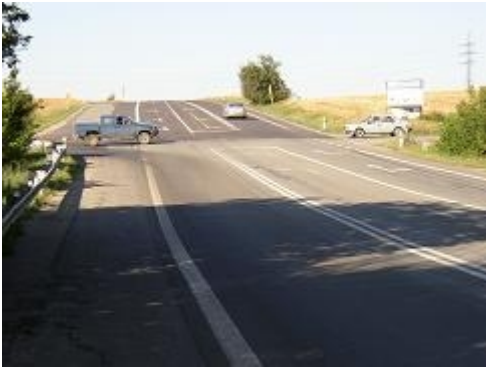
Obr. 22: Rozlehlá a nebezpečná kolizní plocha (II/430, Vyškov-Brno)