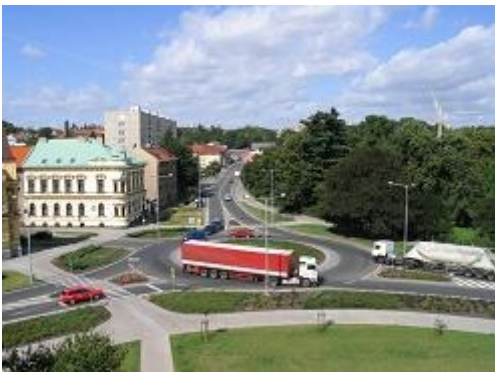
Obr. 23: Styková křižovatka nahrazená okružní (I/37, Chrudim)