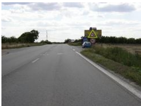
Obr. 4: Špatný kontrast značky na nevhodném pozadí (Brno-Přízřenice)