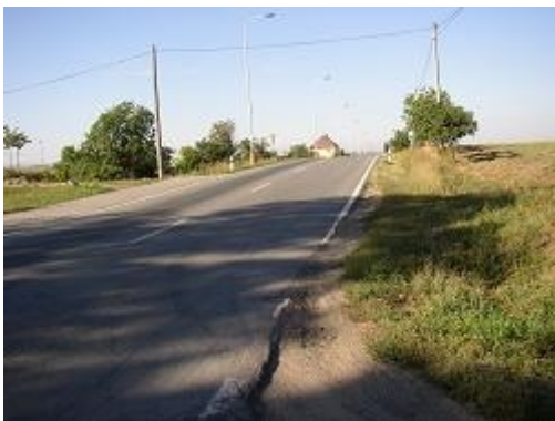
Obr. 19: Nedostatečný dohled na hlavní silnici (II/430, Rousínov)