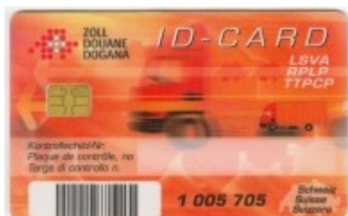
Obr. 3: Čipová ID karta

Všechna tuzemská nákladní vozidla s hmotností nad 3,5 tuny musí být povinně vybavena OBU jednotkou, existuje asi jen 500 výjimek. Zahraniční vozidla mohou být vybavena OBU jednotkou, ale nemusí, pak provádí platbu za ujeté km hotově pomocí terminálů. V současnosti je u zahraničních vozidel nainstalováno pouze cca 2 000 ks OBU jednotek (především se jedná o vozidla z příhraniční oblasti). OBU jednotky jsou distribuovány dopravcům zdarma, uživatel platí jejich instalaci do vozidla. Cena instalace OBU se pohybuje v rozmezí 250,- až 300,- CHF.