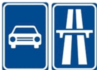
Staré svislé dopravní značení

Pro komunikaci označenou jako „Silnice pro motorová vozidla“ i pro „Dálnice“ však stále platí, že v úseku procházející obcí je nejvyšší dovolená rychlost 80 km/h .