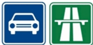
Nové svislé dopravní značení

Další změnou je označení dopravního okruhu, nebo také městského okruhu, která se dočkala výraznějších úprav. Tato značka „ Okruh “, která označuje okruh zřízený pro objíždění obce nebo její části, může být doplněna názvem okruhu, nebo jeho číslem. Nesmíme zapomenout, že takto označená komunikace má svá omezení, např. na takto označení komunikace není možné s vozidlem stát.